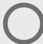
GUARNIZIONE FILETTO 19 X 1 MM